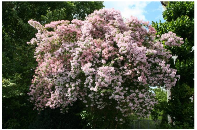
Paradisbuske Kolkwitzia amabilis

Håll jorden under busken öppen, lucker och ogräsfri de första fem åren.