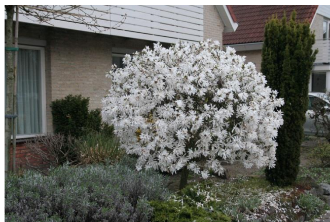
Stjärnmagnolia Magnolia stellata

Kom ihåg att gå ut och njut av dina magnolior, många av dem har också en fantastisk doft!