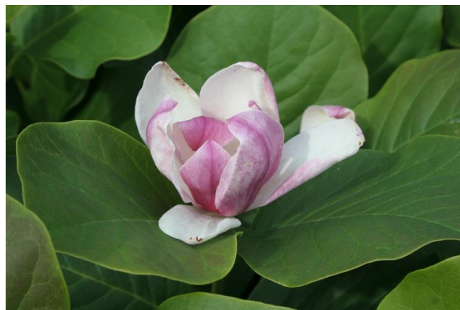
Magnolia 'Fragrant Cloud'

Vänta med att sätta vårlökar och perenner tills magnolian har etablerat sig, eller sätt dem en bit ut! Mikroklimatet gynnas av marktäckare men välj sorter med snälla rotsystem och plantera dem utanför magnolians rötter. Sockblomma, ormöga, myskmadra och vintergröna är exempel på lämpliga växter.