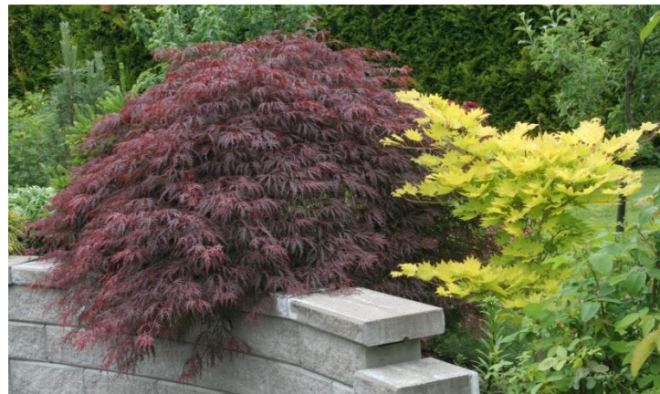
Flikbladig japansk lönn Acer palmatum 'Dissectum' och japansk gyllenlönn, Acer shirasawanum 'Aureum'

Jord: Använd matjorden i din trädgård som bas och förbättra den genom att tillsätta en halv gång så mycket rhododendronjord. Även om japanska lönnar föredrar en svagt kemiskt sur jord är det inget krav. Däremot trivs de inte i jordar med riktigt högt pH.