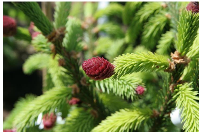
Kottegran Picea abies 'Acrocona'

Plantera inte barrväxter för tätt, de vill ha ljus runt omkring och gillar inte för mycket konkurrens. Plantera helst inte klättrande växter i barrträd, de brukar då tappa barren och bli fula. Många barrväxter har ytliga rötter så du bör inte plantera kraftigväxande eller krävande växter för nära. Men att plantera barrväxter, ljung och andra lämpliga perenner (t ex Armeria , Campanula , Dianthus , Geranium m fl. ) i ett stenparti är mycket dekorativt.